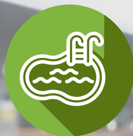
Áreas Húmedas (Turco+Hidromasaje)